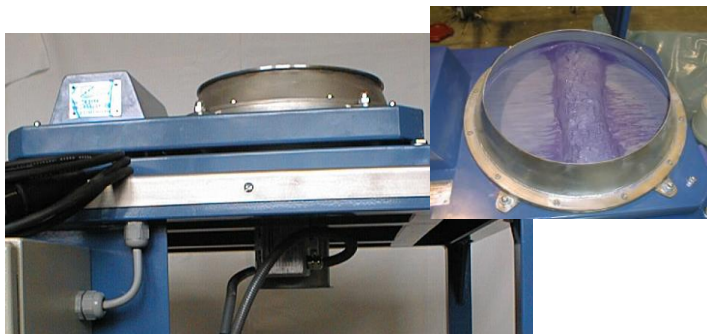
Kombisiebwagen KSW 28 - 600