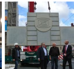
大桥 "Rosenthal", 2012 年 11 月 14 日建于德国奥尔珀