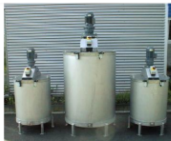
Rührwerksbehälter RW03 & RW10