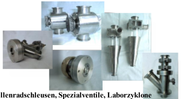
Zellenradschleusen, Spezialventile, Laborzyklone